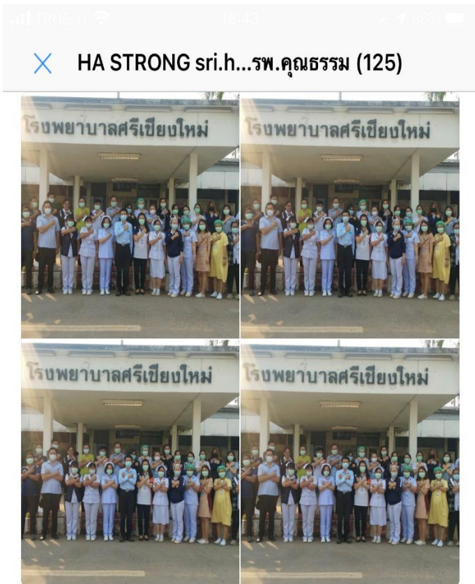
ชมรม HA Strong